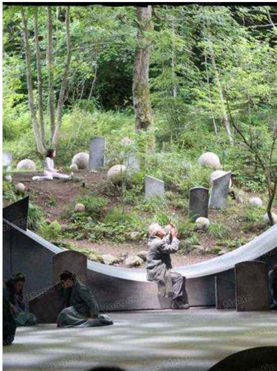
La scène s'ouvre...