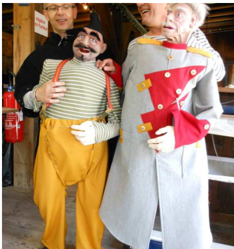
Présentation des personnages